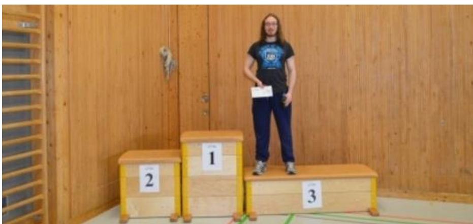
Podest Pilatuscup, Kategorie Herren D

Halbfinale. Langsam roch ich die erste alte Schweisssschicht meinerseits und fühlte die Krampferscheinungen anklopfen. Mein Gegner war erneut ein Junior, diesmal einer, der schon von weitem eine gewisse Müdigkeit oder aber auch Anschiss ausstrahlte. Ich fand es eher belustigend und spielte entsprechend, was dieses Mal leider eine Stufe zu locker war. Aber wenn mir schon im Halbfinale die Kraft für den Vorhandtopspin fehlte, wollte ich damit nicht noch das Finale versauen, und liess meinem Gegner mit 1:3 den Vortritt.