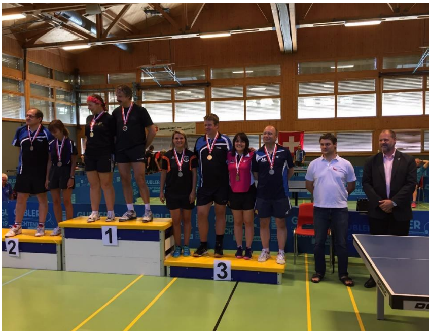
SM Senioren 2017, Kategorie Mixed O40