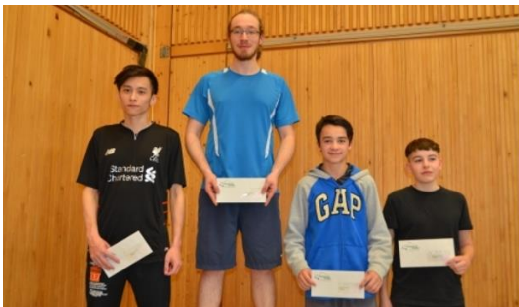
Podest Pilatuscup, Kategorie Herren E

Halbfinale E-Turnier: Ich lobte den Gegner beim Einspielen für seine Linkshändigkeit, während des Spiels kam alles von mir, vor allem aber die Rückhand, von ihm kam weniger, aber ganz und gar nicht die Rückhand, unter dem Strich resultierte ein deutlicher Dreisatzsieg.