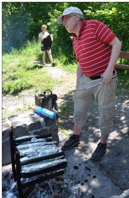
Foto: mehr Forellen haben auf dem Grill nicht Platz